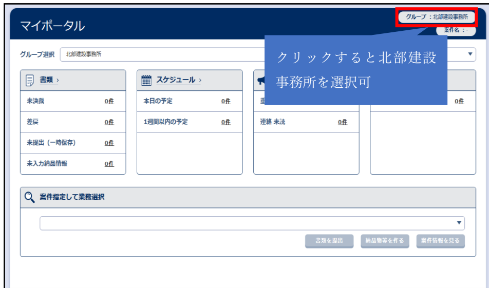
図-2 マイポータル画面